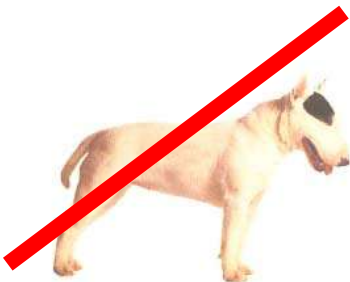
BULL TERRIER (museau droit)

CHIENS NON POTENTIELLEMENT DANGEREUX (molosses n'appartenant pas aux catégories des chiens dangereux, pas de déclaration en mairie, pas de vaccination la rage obligatoire)