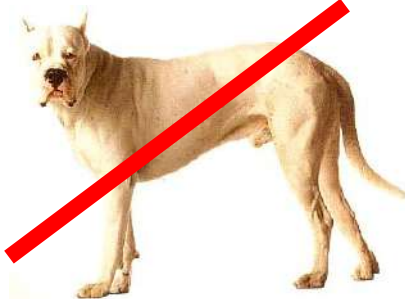
DOGUE ARGENTIN (très grand chien)